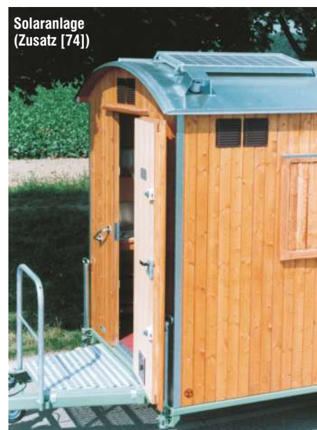
Solaranlage (Zusatz [74])