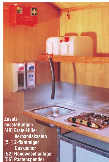
Zusatz- ausstattungen [49] Erste-Hilfe- Verbandskasten [51] 2-flammiger Gaskocher [52] Handwaschanlage [56] Pastenspender