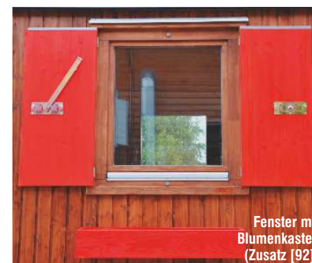
Fenster mit Blumenkasten (Zusatz [92])

Weitere Zusatzelemente fertigen wir auf Wunsch nach Ihren Vorstellungen!