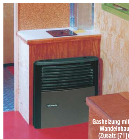
Gasheizung mit Wandeinbau (Zusatz [71])