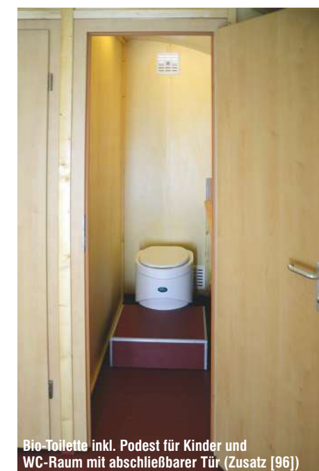
Bio-Toilette inkl. Podest für Kinder und WC-Raum mit abschließbarer Tür (Zusatz [96])

Weitere Zusatzelemente fertigen wir auf Wunsch nach Ihren Vorstellungen!