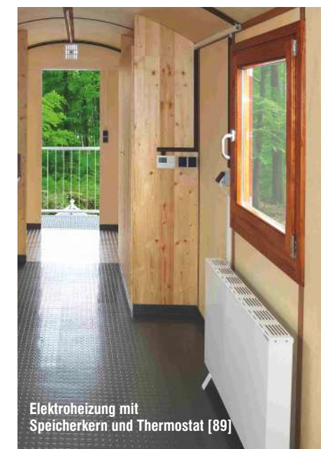
Elektroheizung mit Speicherkern und Thermostat [89]